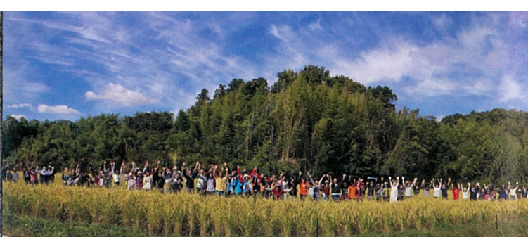
ミクマリの里 100人稲刈り (神戸市・東経 135 度の地にて毎年実施)